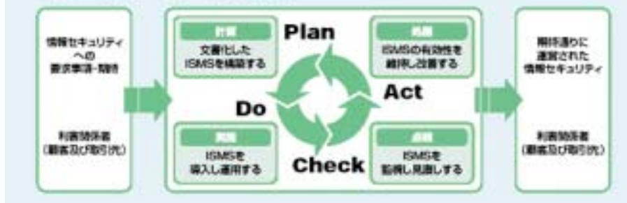
「図 JIPDEC ユーザーズガイド」より