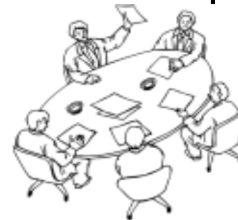
「図 JIPDEC ユーザーズガイド」より