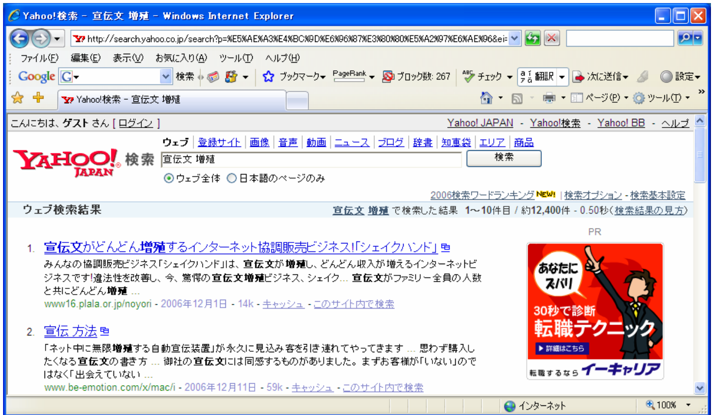
図2 『宣伝文 増殖』での検索結果 (Yahoo! の場合)