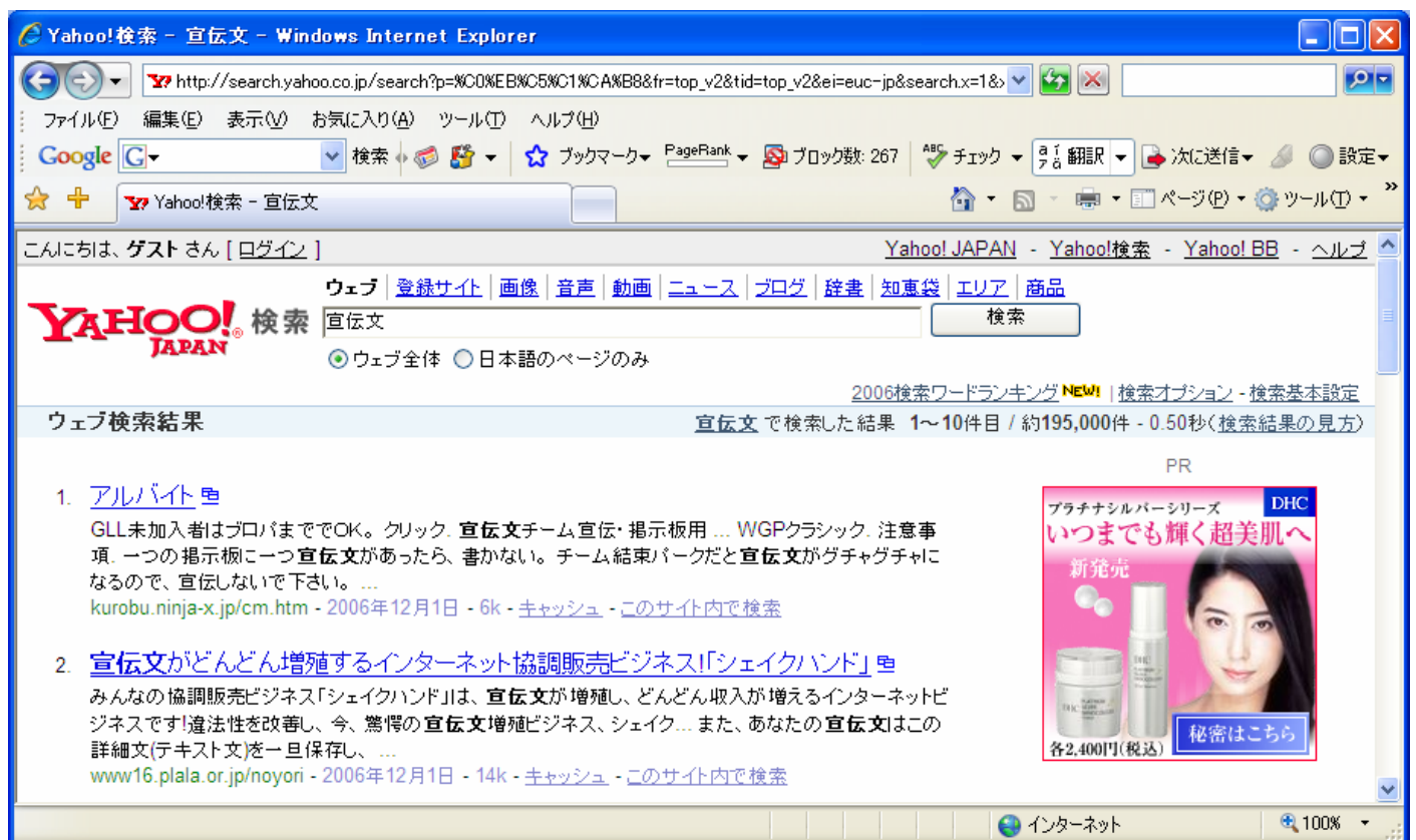
図1 『宣伝文』での検索結果 (Yahoo! の場合)

意図をもって試験してみた『2つのこと』、それらは、この2ページにあります。それを今は明かすつもりはありません。今は、この成果がどう変化していくのだろうと推移を見守ってみようと思っています。