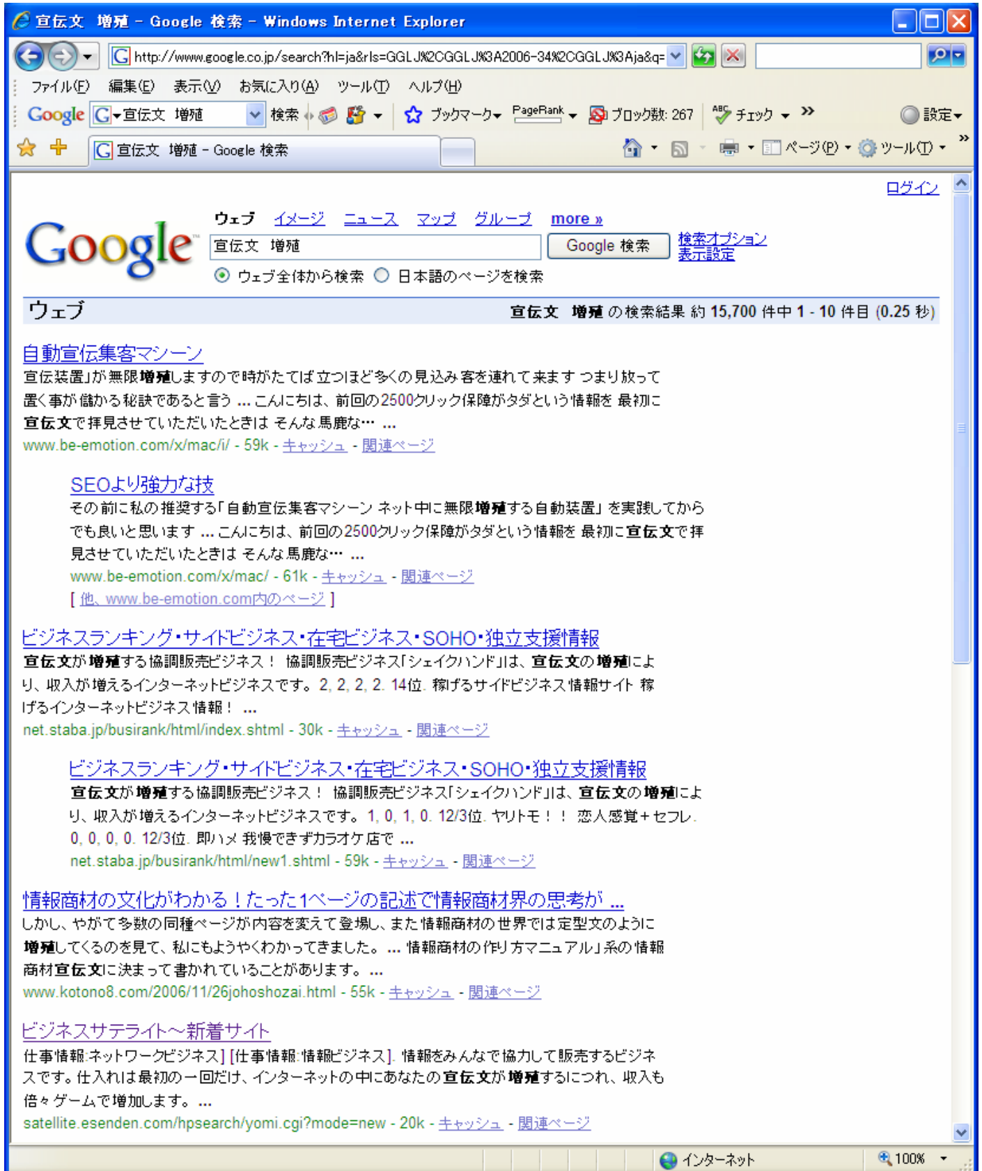
図6 『宣伝文 増殖』での検索結果 (Google の場合)

やはり、トップページに3つ引っかけます。3位、4位、6位です。いずれも、相互リンクした他のサイトでの掲載がヒットしています。今日は、2006年12月12日で、ホームページをアップして2週間目程度ですから、ひょっとすると私のホームページをまだロボットが巡回していないのかも知れません。(自信過剰かな? :笑)