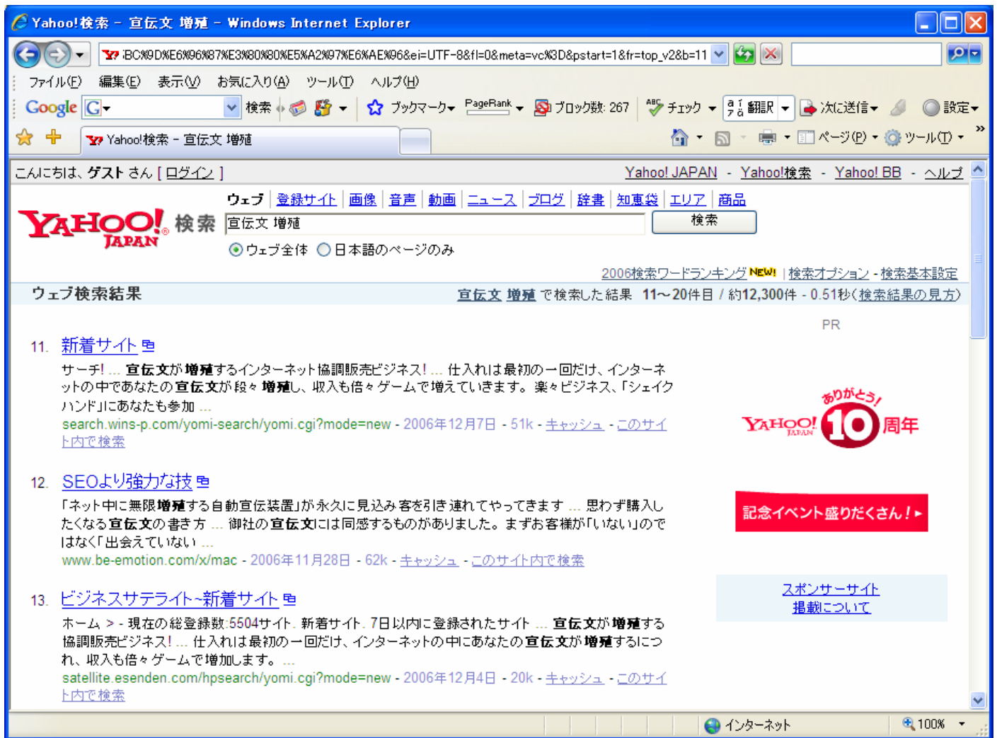
図4 『宣伝文 増殖』での検索結果 (Yahoo! の場合)