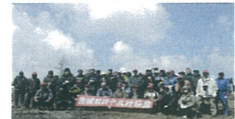
上河湾植林地での2013年秋植林記念写真