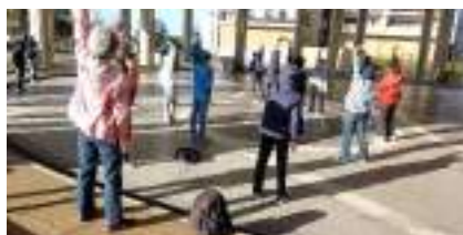
出発前の準備体操

「ヘルスアップ探訪ボラボラ」（愛称「ボラボラ」）は、少し体力がある中年層を対象に学園都市周辺を探訪し、健康増進と地域を知り地域に親しむことをめざすウォーキングです。