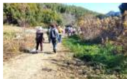
多井畑厄神へ里山を歩く

毎月第2木曜日開催 (8月・9月はなし)、 参加費無料、予約不要ですので 気軽にご参加ください。