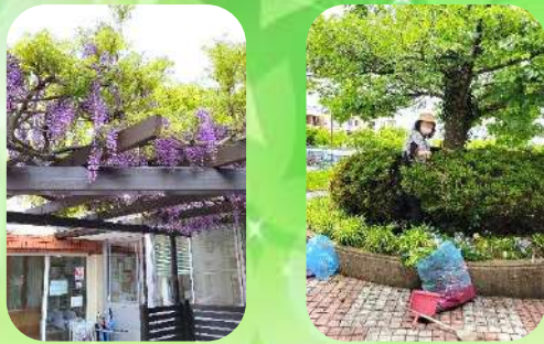
【藤棚の修理も終わり、 藤の花もきれいに咲きました】