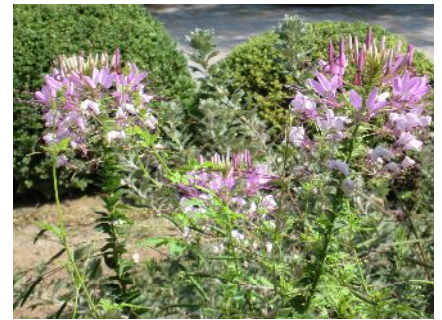
西洋風蝶草というマメ科の植物