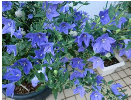
アプローチ沿いに咲く桔梗