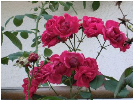
外来駐車場脇に咲くバラ

この暑い中にめげず、当院の花壇には色とりどりの花が咲き誇っています。バラや桔梗、トルコキキョウ、西洋風蝶草など等、夏の日差しを浴びながらも見事に咲いております（下記写真参照）。これらの花は当院正面玄関のアプローチ沿いの花壇などで見ることが出来ますので、期間限定ではありますが、満開や受診にいらした際は是非ご覧いただきたいと思えます。